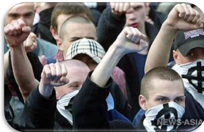
В Костроме скинхеды напали на неформалов